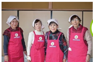
レンコンの力で免疫力アップ!