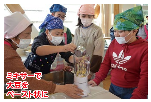
ミキサーで大豆をペースト状に

女性部は2月15日、大原小学校で大豆の加工教室を開き、5年生59人が豆腐づくりに挑戦しました。