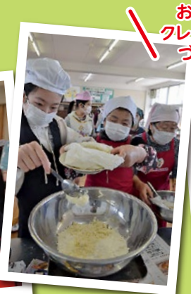
おからはクレープ生地づくりに