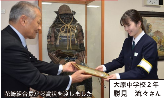
花崎組合長から賞状を渡しました