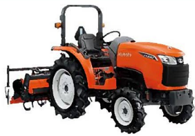
関東6県JAグループ スペシャルトラクター