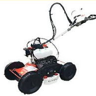
関東6県JAグループ スペシャル法面草刈機